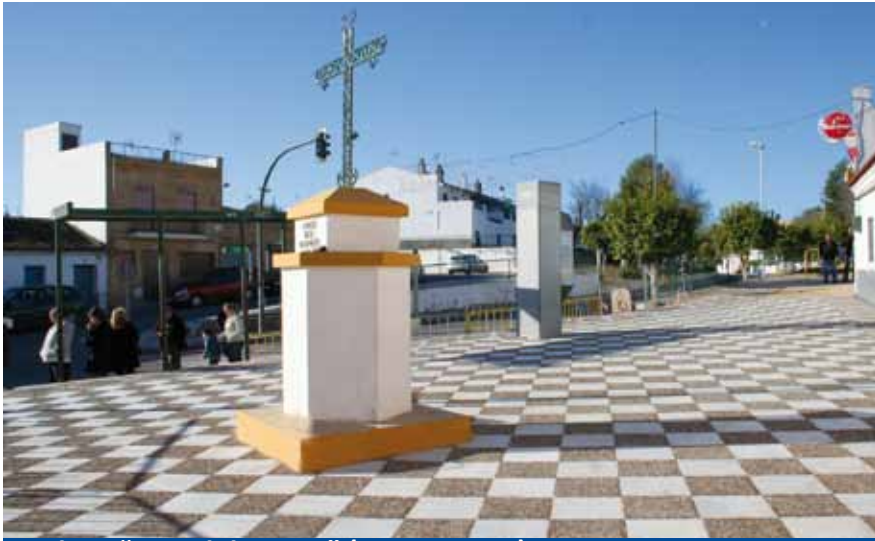
Plaza "Cruz del Barrio" (PFOEA 2012)