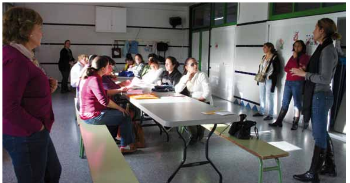
Taller de Costura en las aulas del CEIP San Gregorio.

Un programa que se encontrará en pleno funcionamiento desde el mes de Noviembre a Abril de 2013. Cada actividad cuenta con 15 alumnos, siendo superados el número de alumnas inscritas en el Taller de Costura para esta edición 2012/2013.