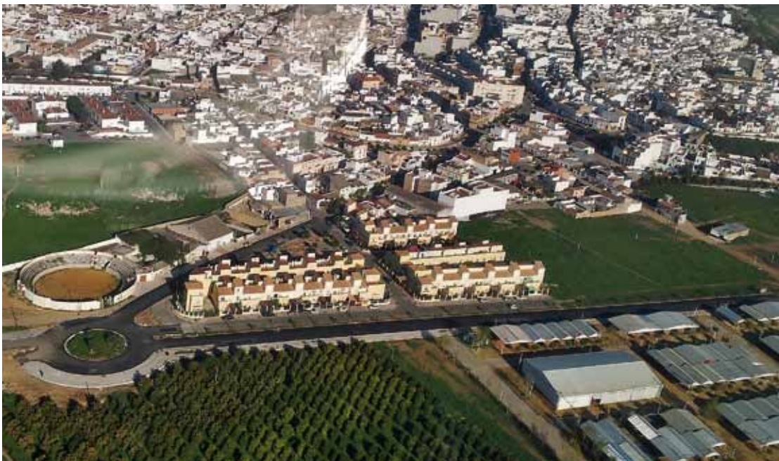
Avda. de los Marineros y Calle Huertas (PLAN PROVINCIAL)

Con la rentabilización de recursos y planificación, se consigue adecuar y mejorar de forma paulatina diferentes zonas