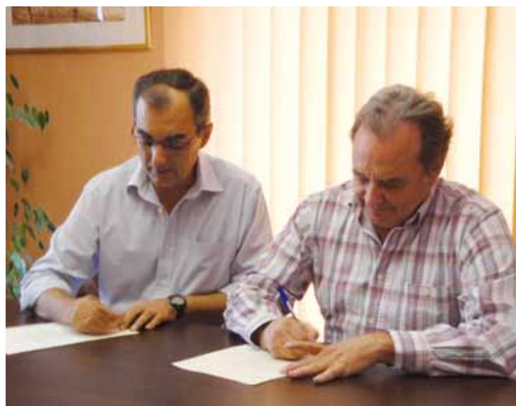
Alcalde de Alcalá del Río y Pte. Protectora en la firma del convenio

En el acuerdo, rubricado entre el Alcalde de Alcalá del Río y Presidente de la Asociación, se detallan diferentes actuaciones como las visitas periódicas a los núcleos de Alcalá del Río, San Ignacio, Esquivel y El