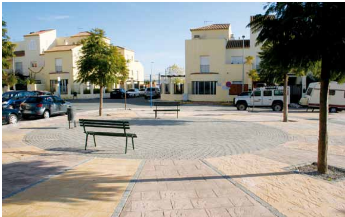
Plazoleta en Urb. Naranjos de la Rivera (Delegación de Infraestructuras)

Una gran intervención que mejora de forma nota-