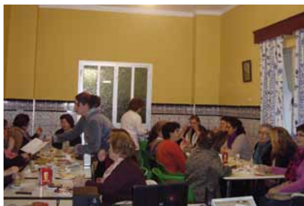
Sesión con las mujeres de El Viar.