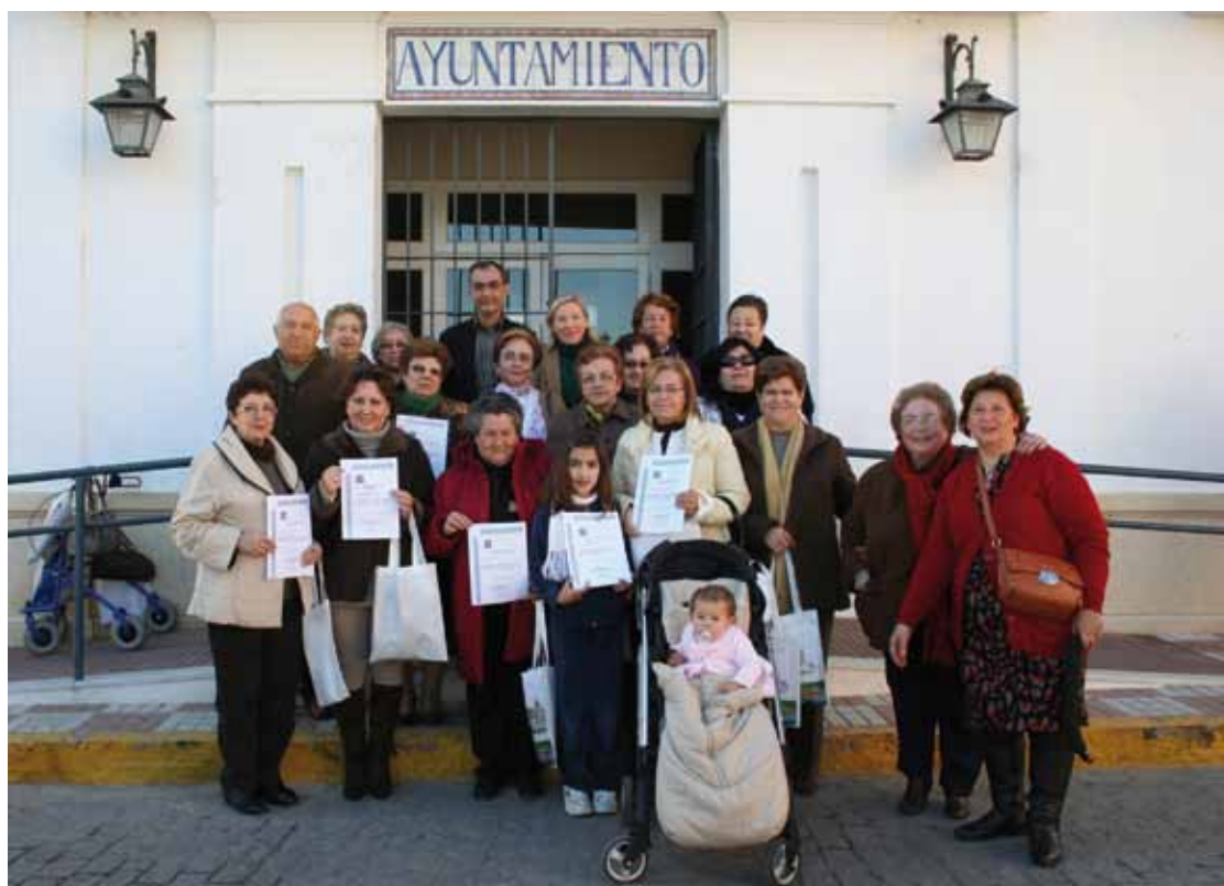
Alumnas y Alumnos participantes en la entrega de diplomas del Taller.

Un programa dirigido a mayores que por diversas razones tienen a su cargo el cuidado de sus nietos y nietas. Una iniciativa que comenzaba en el pasado mes de noviembre en el Hogar del Pensionista "Ignacio Montañó" y que para mayor comodidad y facilitar el acceso al mismo se disponía de una LUDOTECA GRATUITA que atendería a los menores, a cargo de los abuelos, durante las clases.