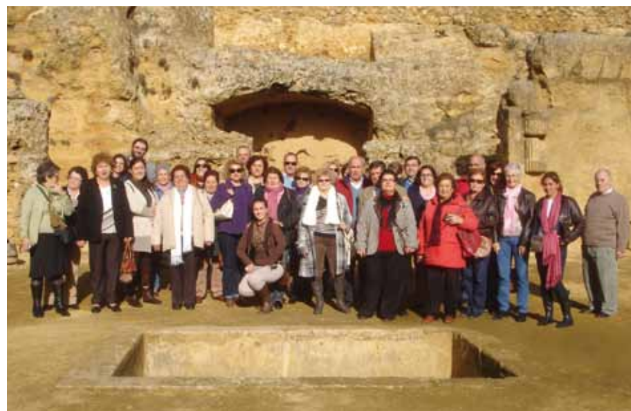
Visita a Carmona.

patrimonial de la ciudad de Osuna, recorriendo la Universidad, la Colegiata, el Monasterio de la Encarnación, el Museo de Arte Sacro y, cómo no, el rico Centro Histórico del municipio.