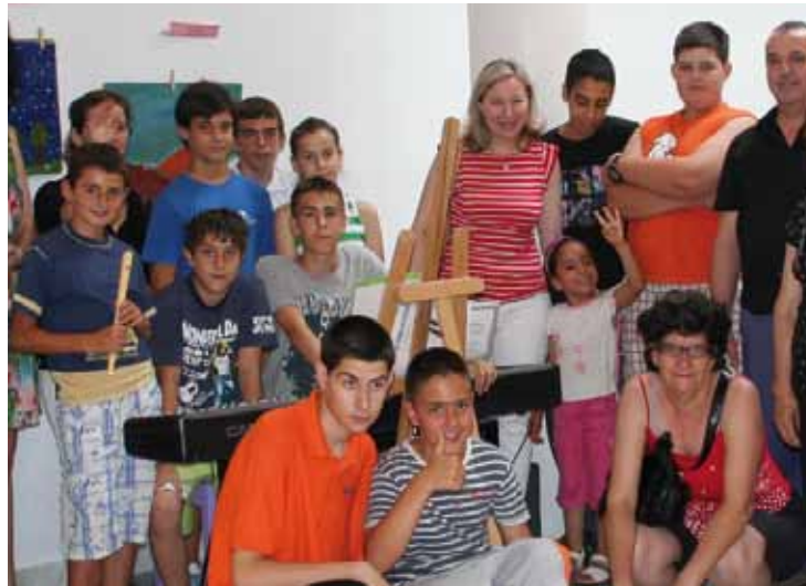
Alumnos en la última exposición realizada.

Así mismo, comprende un área de ocio y tiempo libre especialmente destinada a favorecer el contacto de estos alumnos con la población de su franja de edad, en el que se realizan excursiones, visitas culturales, exposiciones, cursos de informática, jornadas con temas relacionados a los jóvenes, convivencias, etc.