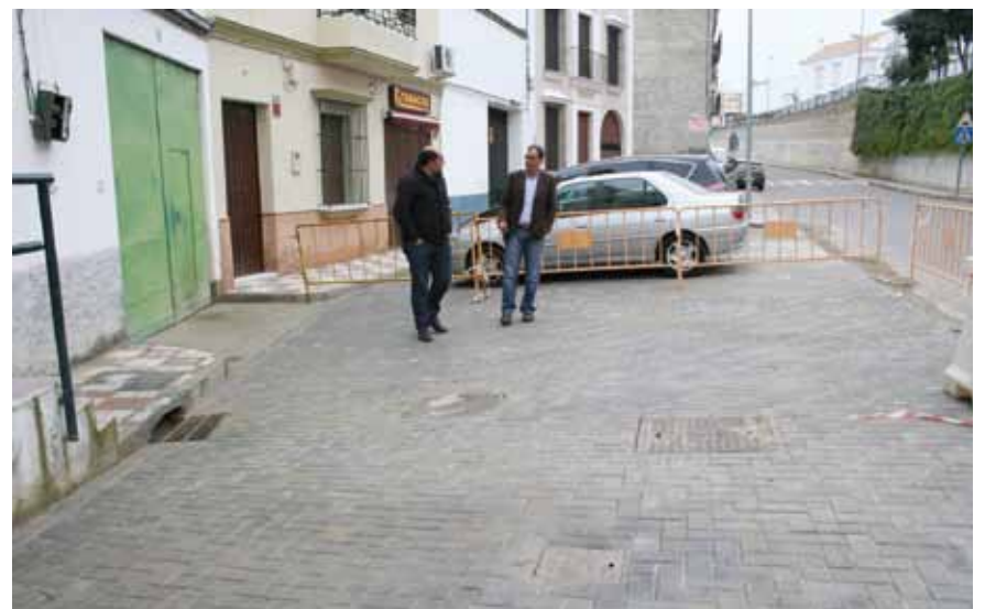
Avda. de Andalucía (PFOEA 2012)