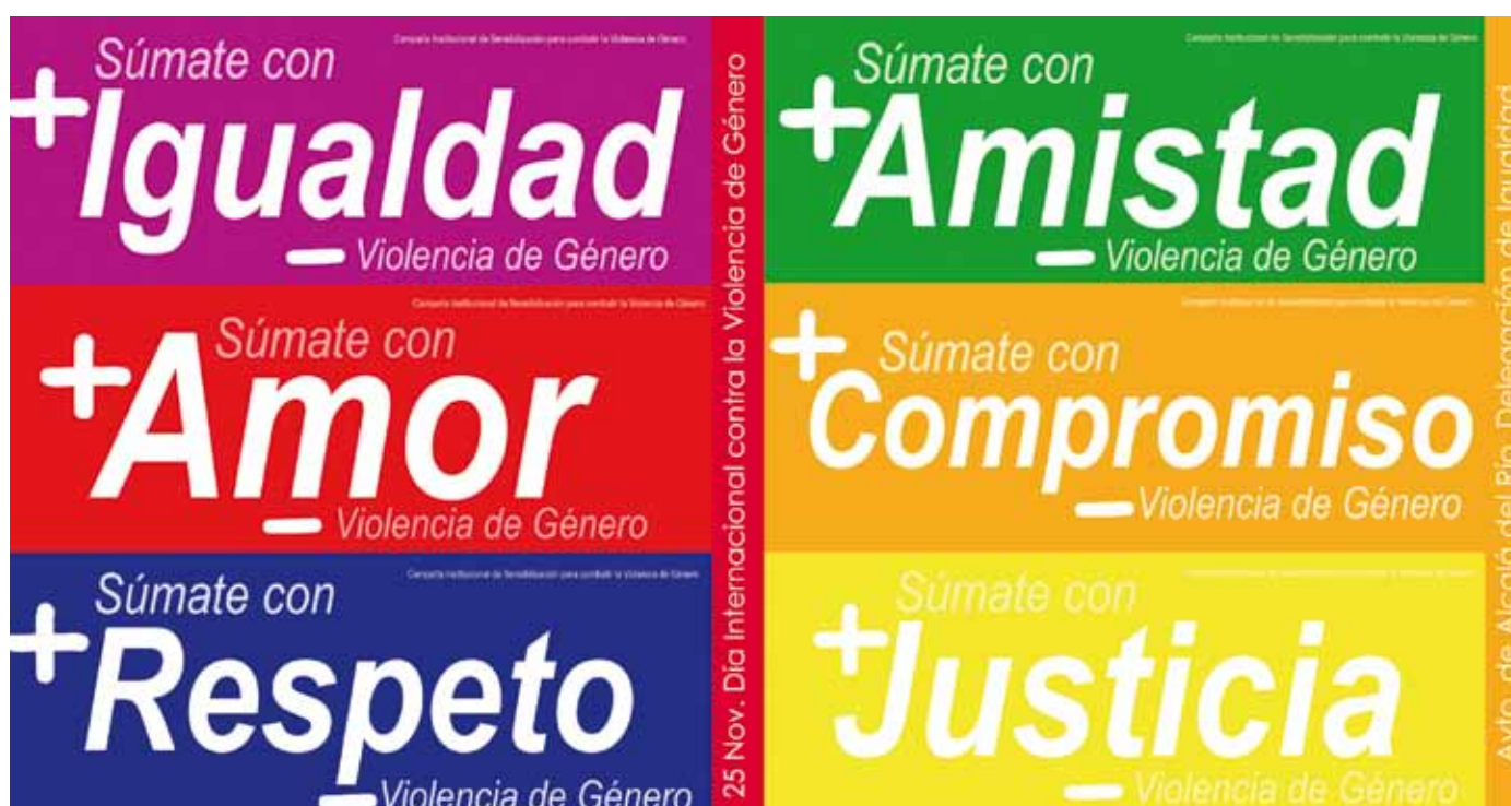
Diseño Campaña Institucional de Sensibilización creada por la Delegación.