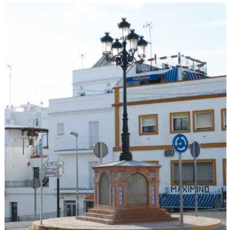
Glorieta C/Asunción (Delegación de Infraestructuras)