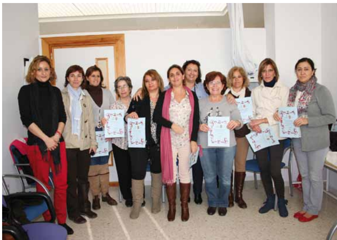
Mujeres participantes en la clausura del Grupo Socioeducativo de Atención Primaria.

Coincidiendo con las actividades organizadas por el Ayuntamiento de Alcalá del Río, para la celebración del Día Internacional de Violencia de Género, los GRUSE-M fueron incluidos en el programa por la Delegación de Igualdad, ya que