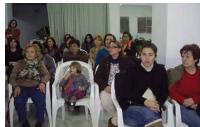
Sesión de cine en el Salón social de Esquivel.