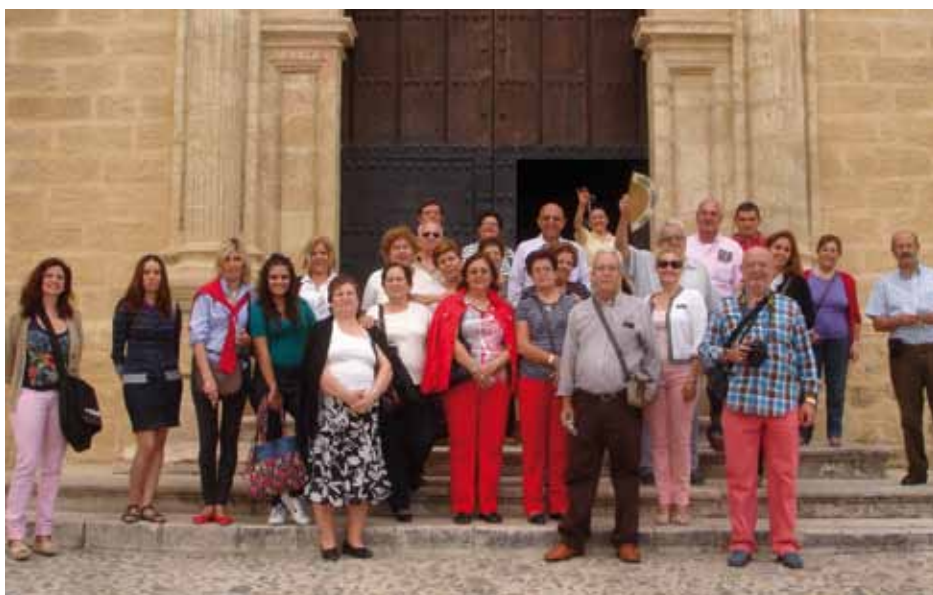
Visita a Osuna.

La Delegación de Cultura dentro de su programación del Otoño Cultural 2012 organizó dos visitas culturales, una la Ciudad de Osuna, y una segunda, al municipio de Carmona.