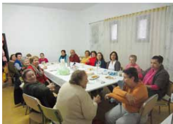
Sesión de Cine y merienda en San Ignacio.