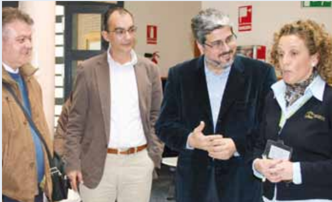
Visita del Delegado Provincial al Centro de Salud.

El equipo de profesionales del Centro de Salud de Alcalá del Río fue reforzado desde el pasado mes de octubre con otro pediatra, por lo que la población infantil de nuestro municipio, con edades comprendidas entre 0-14 años, ya es atendida por dos profesionales en el horario habitual en vez de por uno, como sucedía hasta ahora.