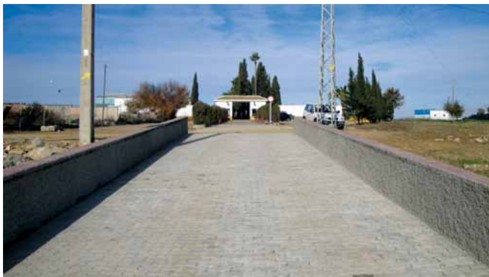
Camino del Cementerio (PFOEA 2012)

De esta manera se ha ejecutado la construcción del nuevo monolito en la Glorieta de Calle Asunción, aprovechando la donación de una farola “fernandina” por parte de la Diputación de Sevilla. Así como, el monolito que desde años los vecinos de la Barriada San Gregorio venían reclamando, o como la construcción de acerado en lado derecho de la carretera y acceso a C/San Benito, Pinar del Río, etc.