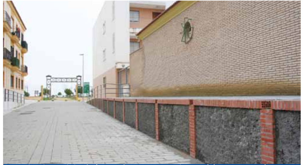
Avda. de Andalucía (muro frente Venta El Santo) (PFOEA 2012)

Con la rentabilización de recursos y planificación, se consigue adecuar y mejorar de forma paulatina diferentes zonas